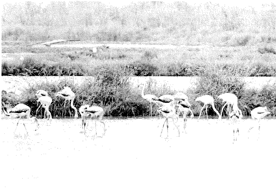
Un grup de flamencs a la llacuna de la reserva de Riet Vell, un espai gestionat per SEO/Birdlife al delta de l'Ebre que pretén demostrar la viabilitat d'un projecte de desenvolupament sostenible. A Riet Vell s'apleguen l'agricultura ecològica de l'arròs i la recuperació d'hàbitats naturals de zones humides.

► Compra de terrenys. Els Ullals de Panxa són unes surgències d'aigua dolça que apareixen al delta de l'Ebre. Són aigües d'altíssima qualitat procedents d'aqüífers subterranis. Tot i el seu