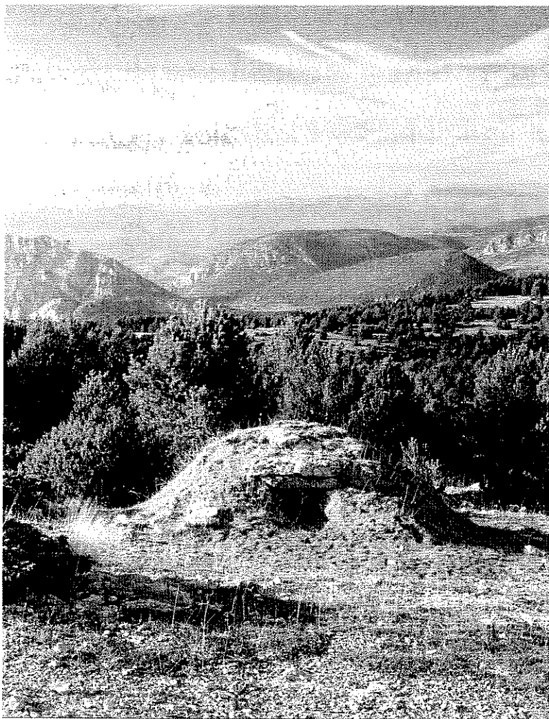
Un antic pou per conservar patates a la muntanya d'Alinyà, a l'Alt Urgell, una zona gestionada per la Fundació Territori i Paisatge.

Segons les dades de la Xarxa de Custòdia del Territori, a Catalunya, Andorra i les Illes Balears s'han fet fins ara 208 acords de custòdia en finques privades i públiques, a càrrec de 39 entitats de custòdia i dels propietaris de les diferents finques. Aquests acords sumen una superfície de més de 86.631 hectàrees. La majoria d'acords són convenis o contractes jurídics (81%), en segon lloc hi ha les compres de finques per les entitats (14%), i per últim, els acords verbals (5%), utilitzats per les entitats més petites. El 75.6% dels acords de custòdia es fan en finques de propietat privada i la resta, en finques públiques. La Fundació Territori i Paisatge Caixa Catalunya, la Fundació Josep Carol, el GOB Menorca, la Societat Espanyola d'Ornitologia i la Fundació Natura són les entitats amb un nombre més alt d'acords. Tot i això, cada cop hi ha més petites entitats locals i comarcals que també utilitzen la custòdia del territori.